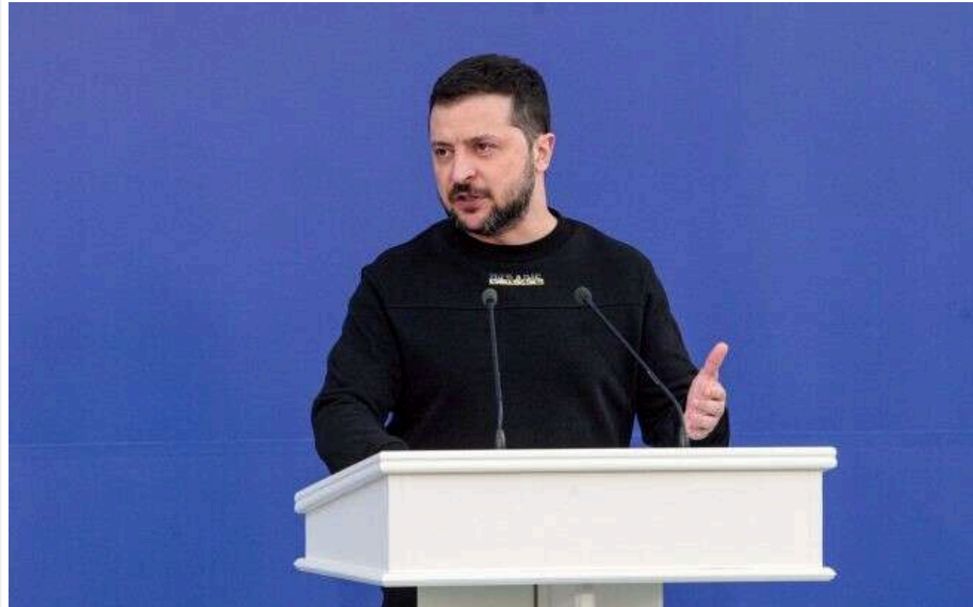
Зеленський відвідав Варшаву з візитом: заплановані переговори з Туском і Дудою

У середу, 15 січня, президент України Володимир Зеленський прибув до Варшави з офіційним візитом. Під час перебування в Польщі Зеленський планує провести переговори з польськими високопосадовцями, зокрема з прем'єр-міністром Дональдом Туском та президентом Польщі Анджеєм Дудою.