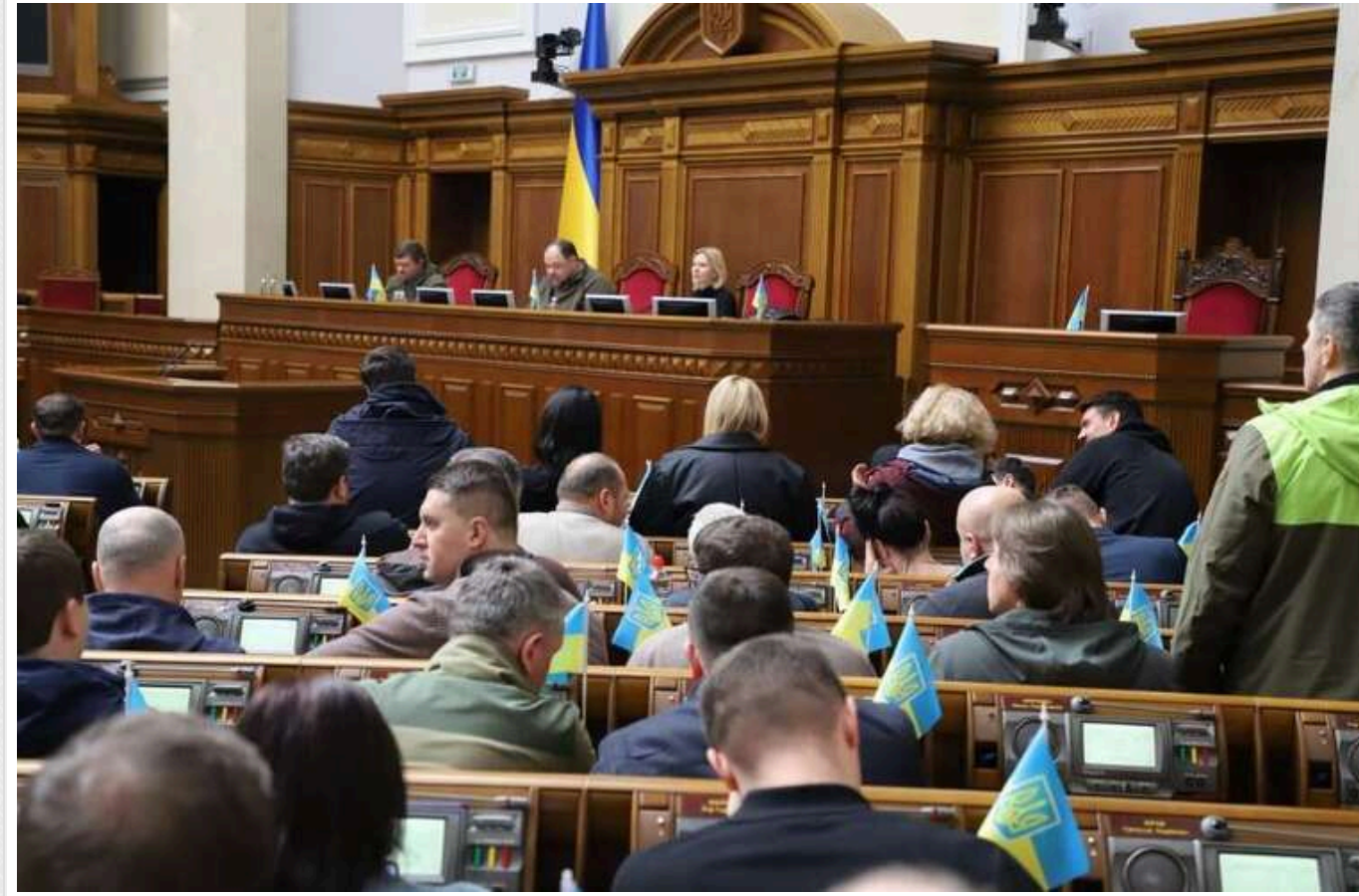
ЗМІ не каратимуть за негативні коментарі щодо посадовців, якщо ті видалятимуть їх протягом 3 днів, – закон

Згідно з законом, медіа повинно буде видалити коментарі читачів зі звинуваченнями посадовців протягом 3 робочих днів із моменту отримання скарги чи рішення Нацради або ухвали про відкриття відповідного провадження судом.