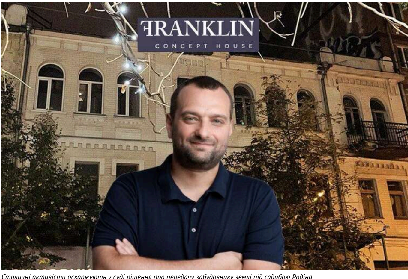
Столичні активісти оскаржують у суді рішення про передачу забудовнику землі під садибою Родіна

В історії запланованого будівництва житлового комплексу (ЖК) Franklin Concept House на місці садиби Оси́па Роді́на (вул. Олеса Гончара, 71) може трапитися несподіваний фінал.