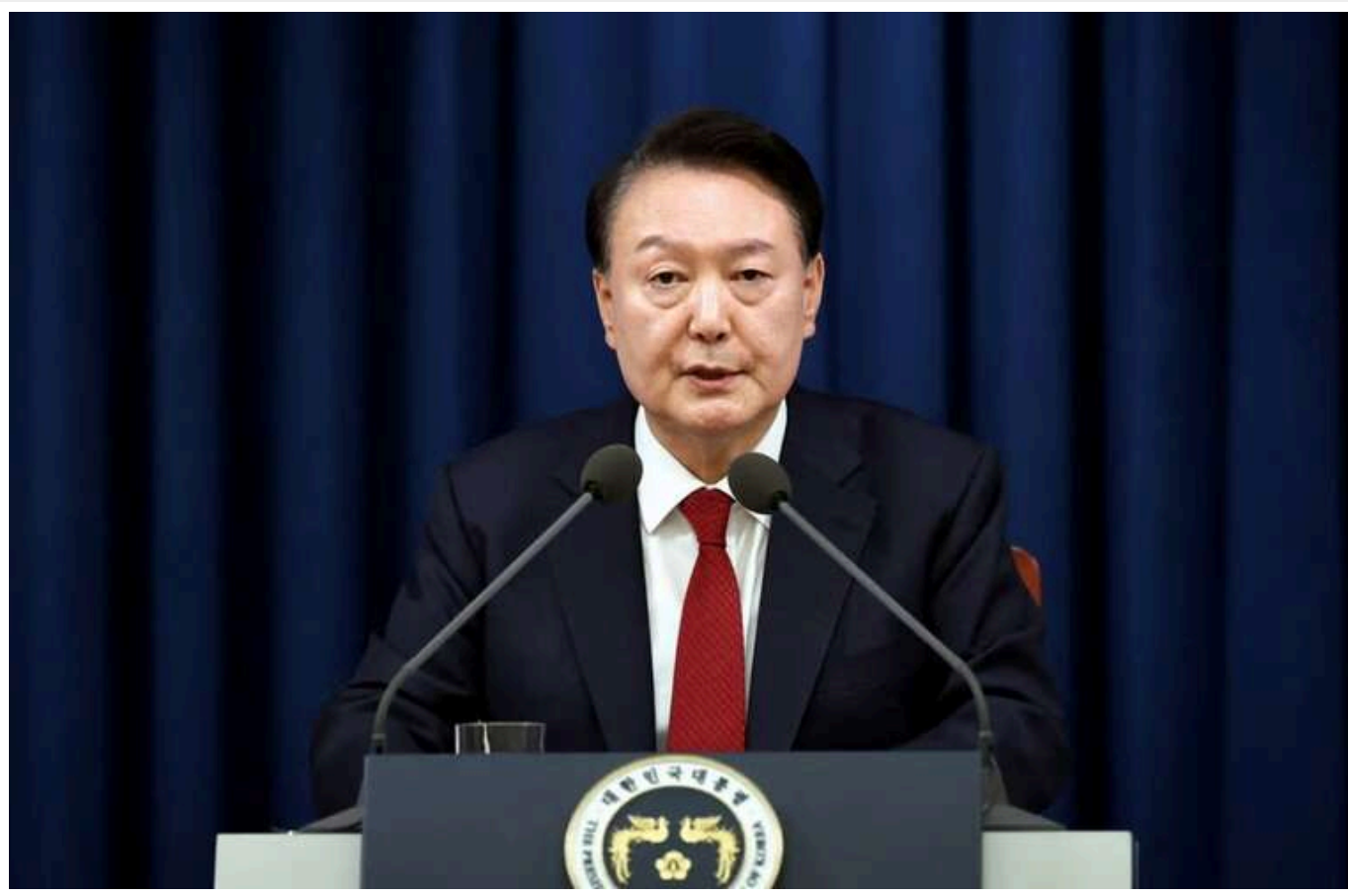
У Південній Кореї заарештували відстороненого президента

Сьогодні слідчі завітали до резиденції усунутого президента Південної Кореї Юн Сок Йоля, щоб здійснити другу спробу його арешту. Цього разу правоохоронцям вдалося затримати главу держави.