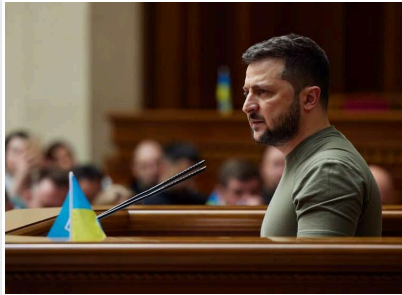
Президент Зеленський запропонував продовжити мобілізацію та воєнний стан

Пропонується продовжити дію воєнного стану та загальної мобілізації в Україні з 8 лютого ще на 90 днів.