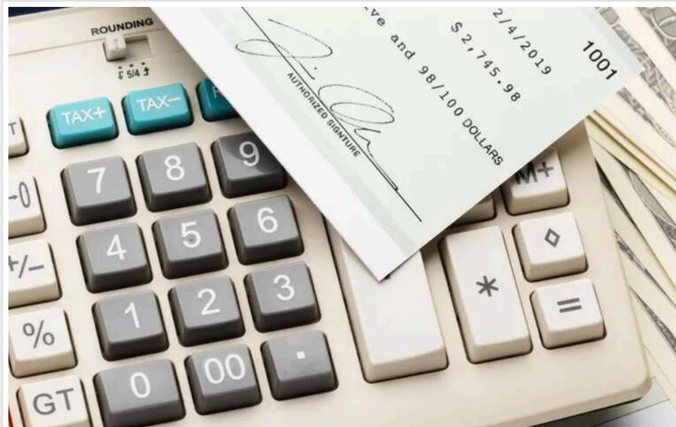
Україна планує оподаткувати цифрові платформи: бюджет може отримати до 10 мільярдів гривень щороку

Україна розробляє законопроект щодо оподаткування цифрових платформ, таких як Ukloп, Bolt та Glovo, і це може додати до бюджету 10 млрд грн щороку. Основна ставка податку, вірогідно, буде 5%, а самі платформи будуть податковими агентами, автоматично утримуючи податок з доходів користувачів.