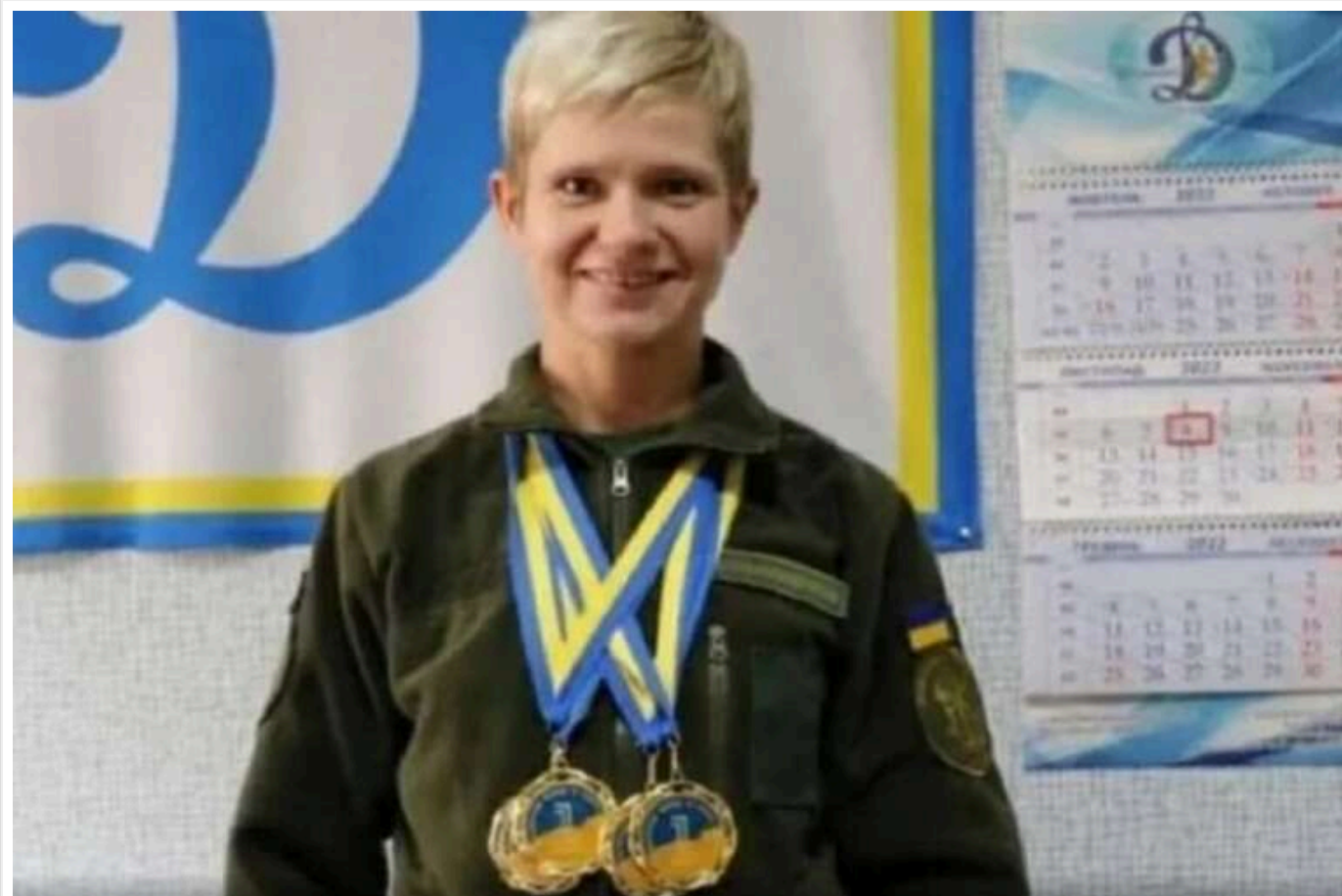
Українська веслувальниця Жалінська втекла до Росії, заявивши, що вона «росіянка»

В інтерв'ю російським пропагандистам Жалінська заявила, що «вона росіянка».