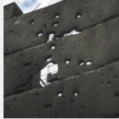
Як виглядає українська ТЕЦ, що пережила не одну ракетну атаку російських загарбників