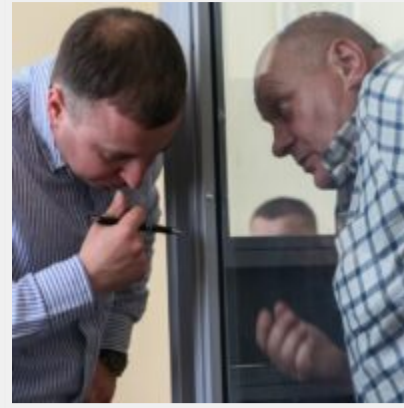
Бюджетні тисячі доларів для віртуальних вебка-студій: як полковники Нацполіції трьох областей погорли на порно