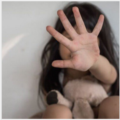
Зґвалтував 13 дітей: шокуючі подробиці справи на Одещині