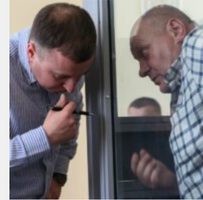
Бюджетні тисячі доларів для віртуальних вебкам-студій: як полковники Нацполіції трьох областей погоріли на порно