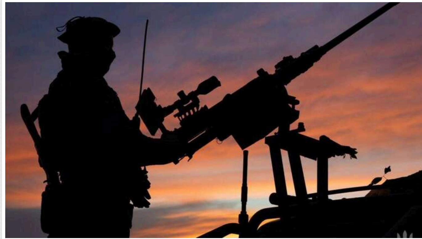
Сили ППО з вечора збили 58 ворожих дронів, 21 з них втрачено локаційно

Сили оборони знищили 58 ударних дронів типу Shahed та інших безпілотників, якими росіяни з вечора 13 січня атакували Україну.