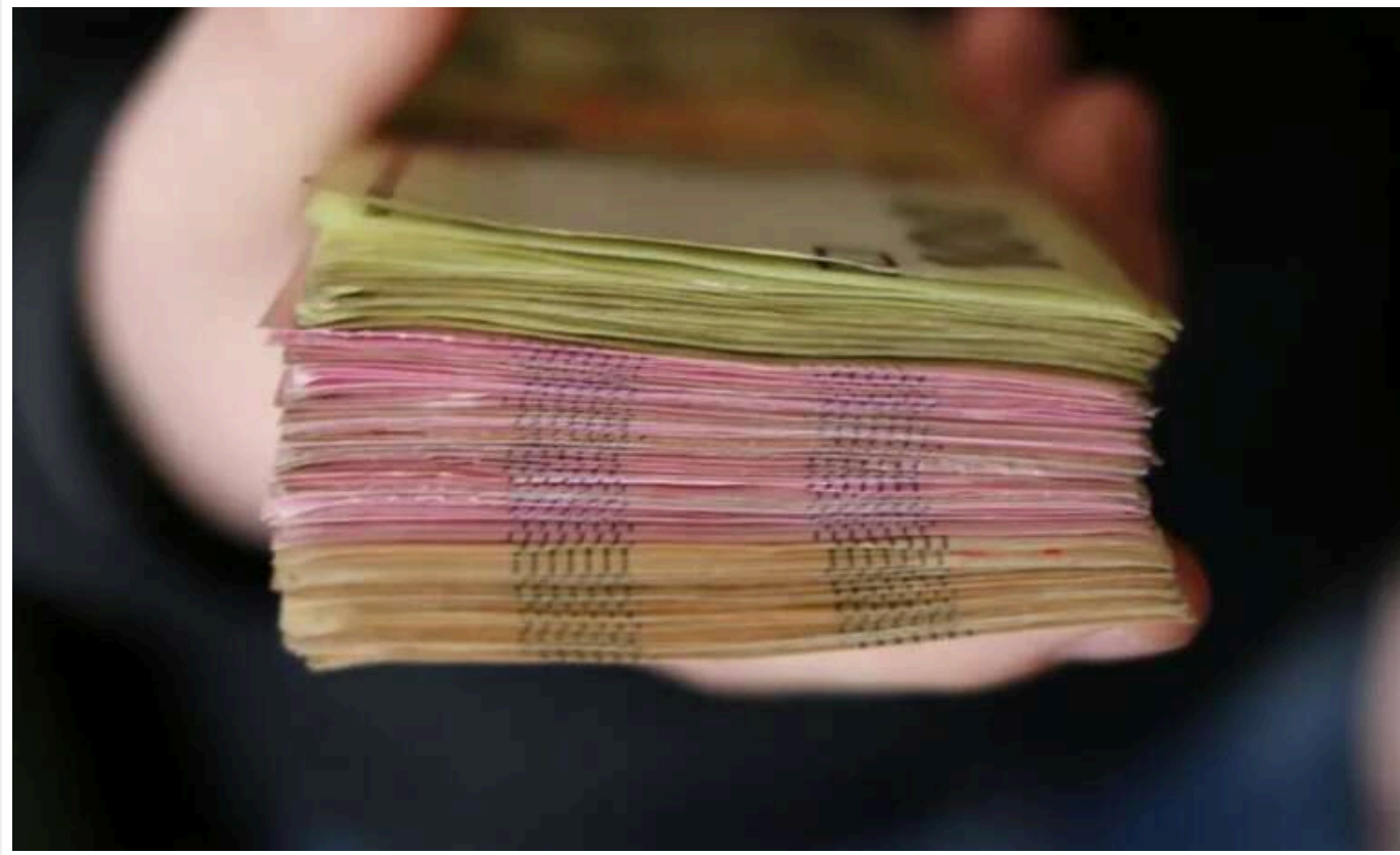
У 2025 році українцям призначили найнижчу мінімальну зарплату в Європі

В Україні мінімальна зарплата в 2025 році залишатиметься на рівні 8000 грн. Це найнижчий показник у Європі як за номінальною сумою, так і за співвідношенням середньої та мінімальної зарплати.