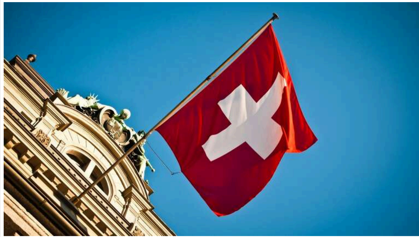
ЄС підтримав запрошення Швейцарії приєднатися до "військового Шенгену"

Європейський Союз у понеділок, 13 січня, офіційно затвердив запрошення Швейцарії до участі у програмі "Військовий Шенген", що передбачає безперешкодне переміщення військ у Європі.