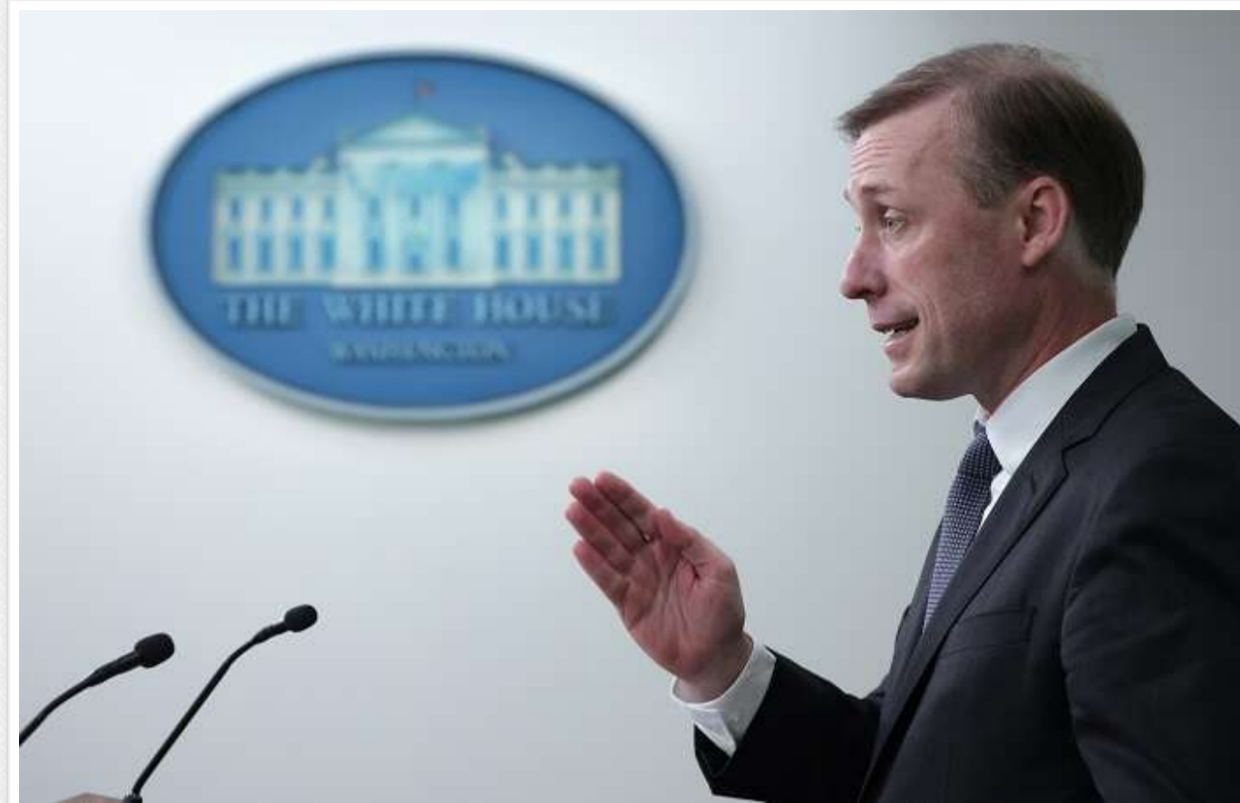
Радник Байдена спростував чутки про ментальний спад президента

Радник президента США з національної безпеки Джейк Салліван заявив, що звинувачення в ментальному спаді 82-річного Джо Байдена не мають під собою підстав.