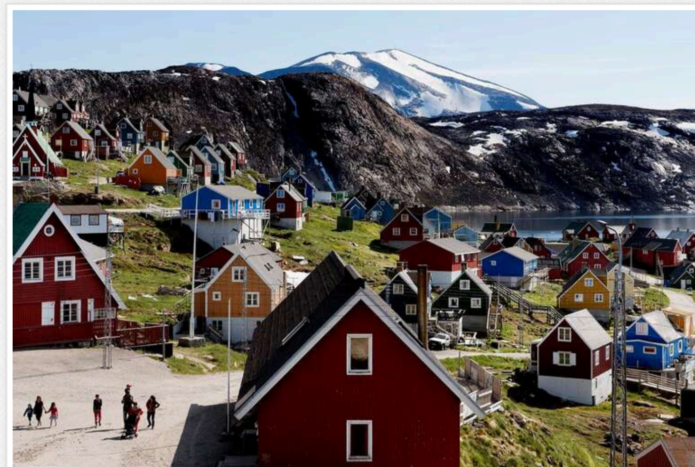
Гренландські партії проти ідеї Трампа щодо приєднання острова до США

Усі п'ять партій парламенту Гренландії виступили проти пропозиції Дональда Трампа щодо приєднання острова до США, повідомляє Радіо Данії.