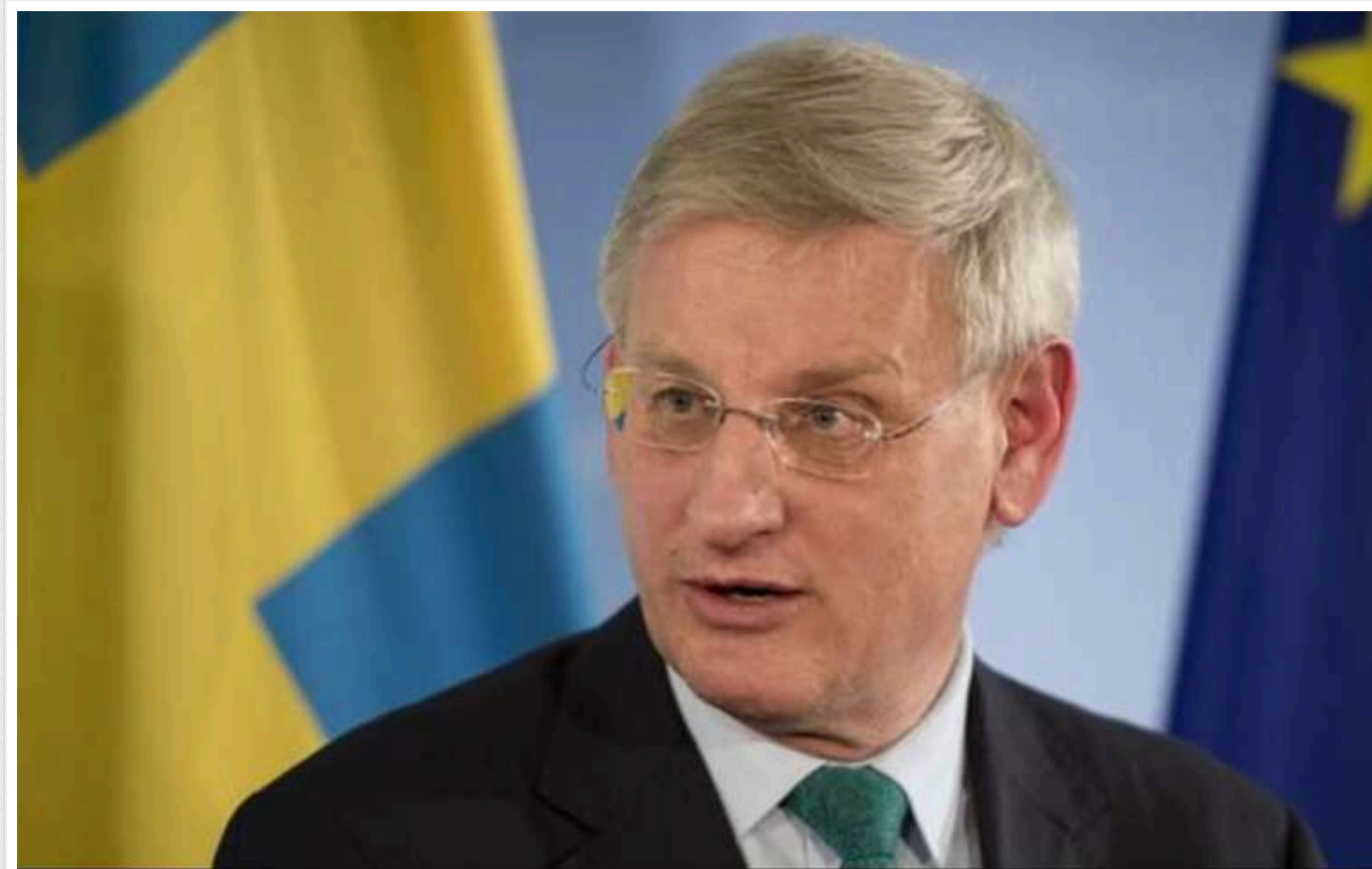
Пропозиція Трампа щодо Гренландії є абсурдною та небезпечною, - експрем'єр Швеції

Ідея обраного президента Сполучених Штатів Америки Дональда Трампа приєднати Гренландію до США є недоцільною та небезпечною. Насправді послідовний та виважений розвиток відносин Гренландії з Данією - це найкращий вибір для острова.