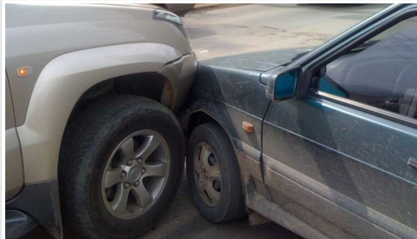
Українським водіям дозволять не викликати поліцію при незначних ДТП

Кабінет Міністрів України затвердив нові правила для водіїв, згідно з якими тепер не потрібно звертатися до поліції у випадку ДТП, якщо постраждали тільки автомобілі, а водії не перебувають у стані алкогольного або наркотичного сп'яніння.