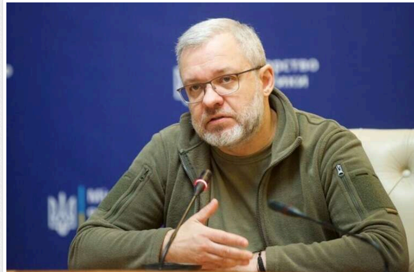
У Раді зареєстровано постанову щодо відставки міністра енергетики Галуценка

У Верховній Раді зареєстрували постанову про звільнення міністра енергетики України Германа Галуценка.