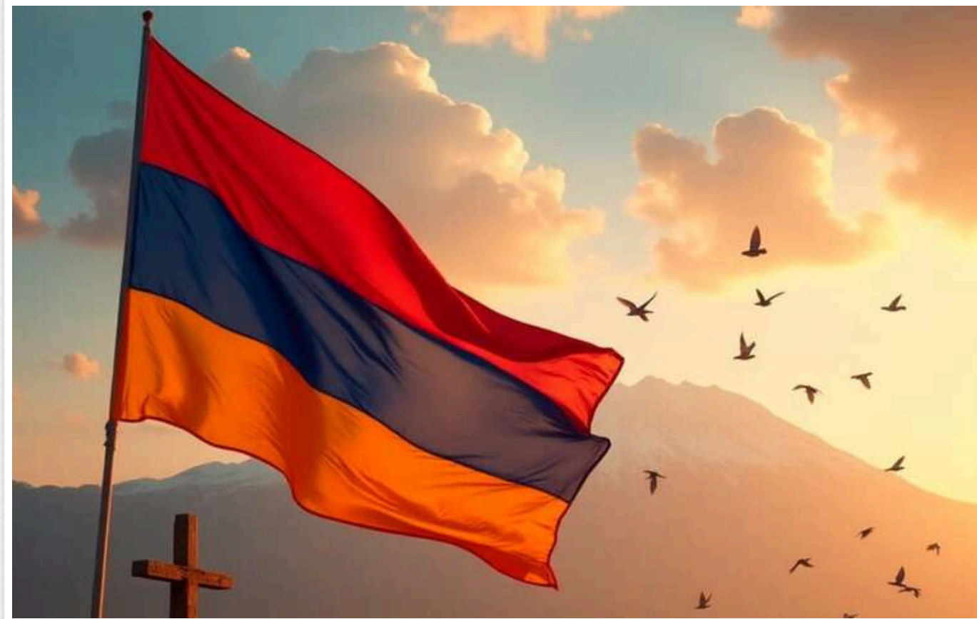
Вірменія не збирається виходити з ЄАЕС, незалежно від свого наміру приєднатися до ЄС