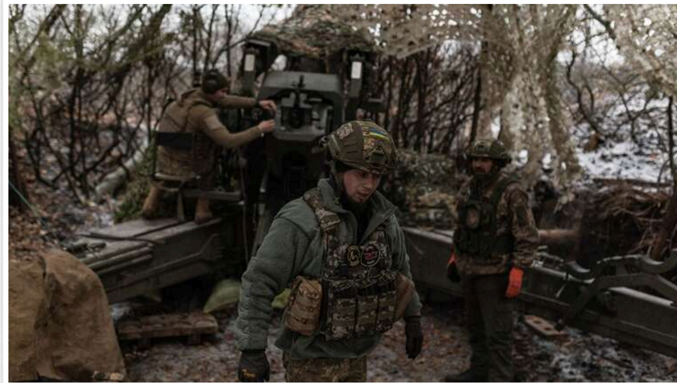
Ситуація на фронті: російські війська атакують на шести напрямках

З початку доби російські війська здійснили 94 атаки на позиції українських оборонців. За оперативною інформацією Генштабу ЗСУ, бої тривають на шести напрямках фронту, зокрема, найгарячіше – на Покровському напрямку.