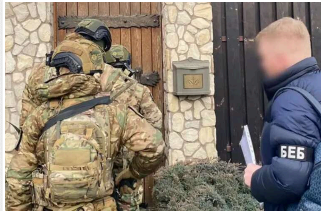
БЕБ викрила на Київщині цех, який підробляв каву відомих світових брендів: вилучено товару на 20 мільйонів гривень

Детективи територіального управління Бюро економічної безпеки в Київській області зупинили діяльність нелегального підпільного цеху з виготовлення кави відомих світових брендів.