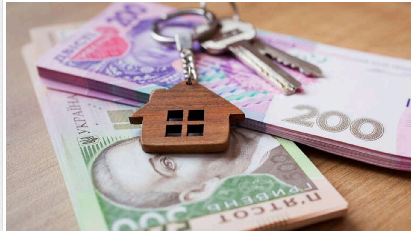
Переселенці зможуть отримати субсидії на оренду житла з 29 січня

З 29 січня внутрішньо переміщені особи зможуть отримати субсидії на оренду житла.