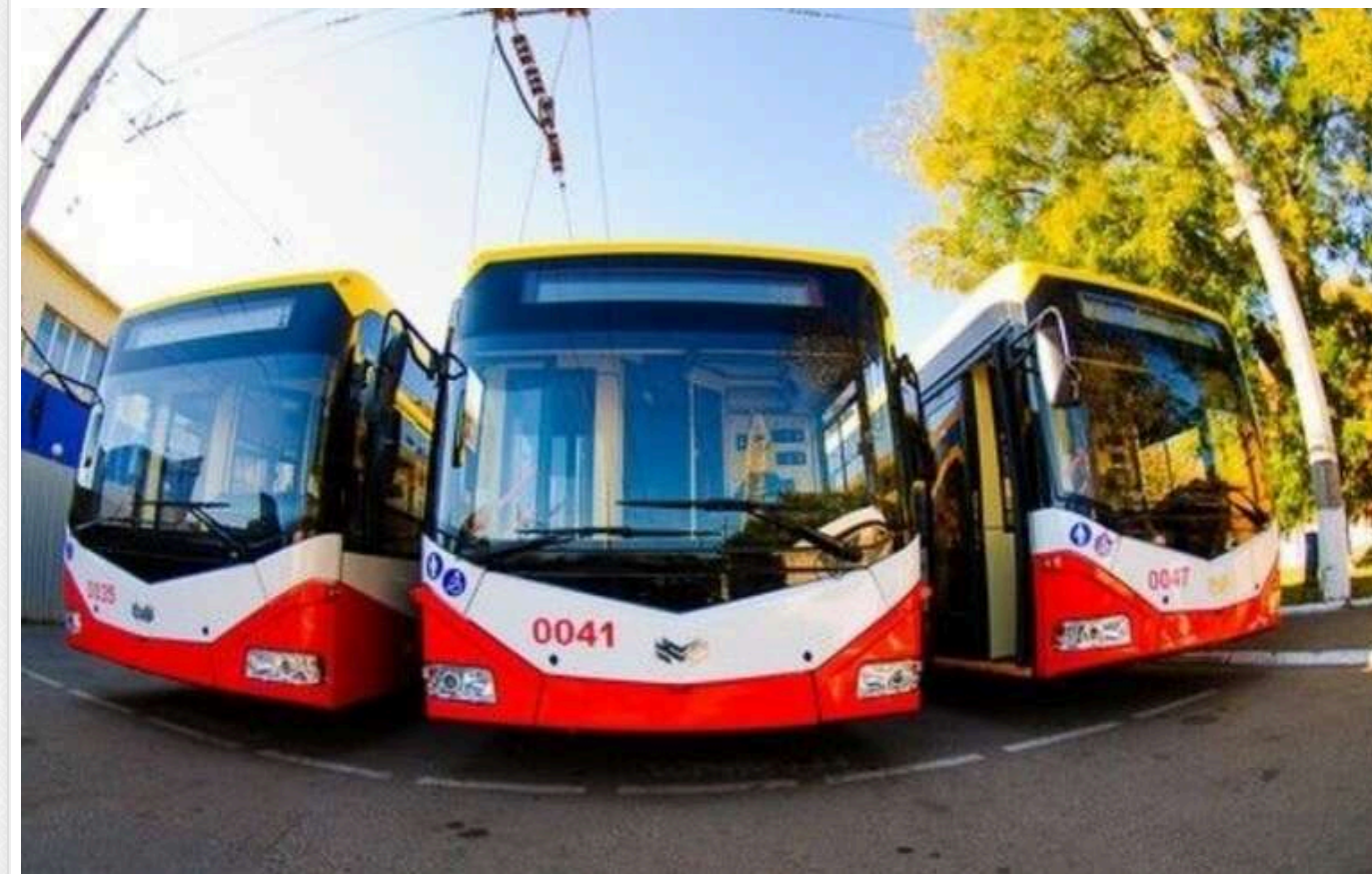
В Одесі об'єкти «Одесміськелектротранс» замість держави охоронятиме фірма, пов'язана з депутатом облради

Комунальне підприємство «Одесміськелектротранс» вирішило витратити бюджетні кошти на приватну охоронну фірму депутата обласної ради від «Батьківщини».