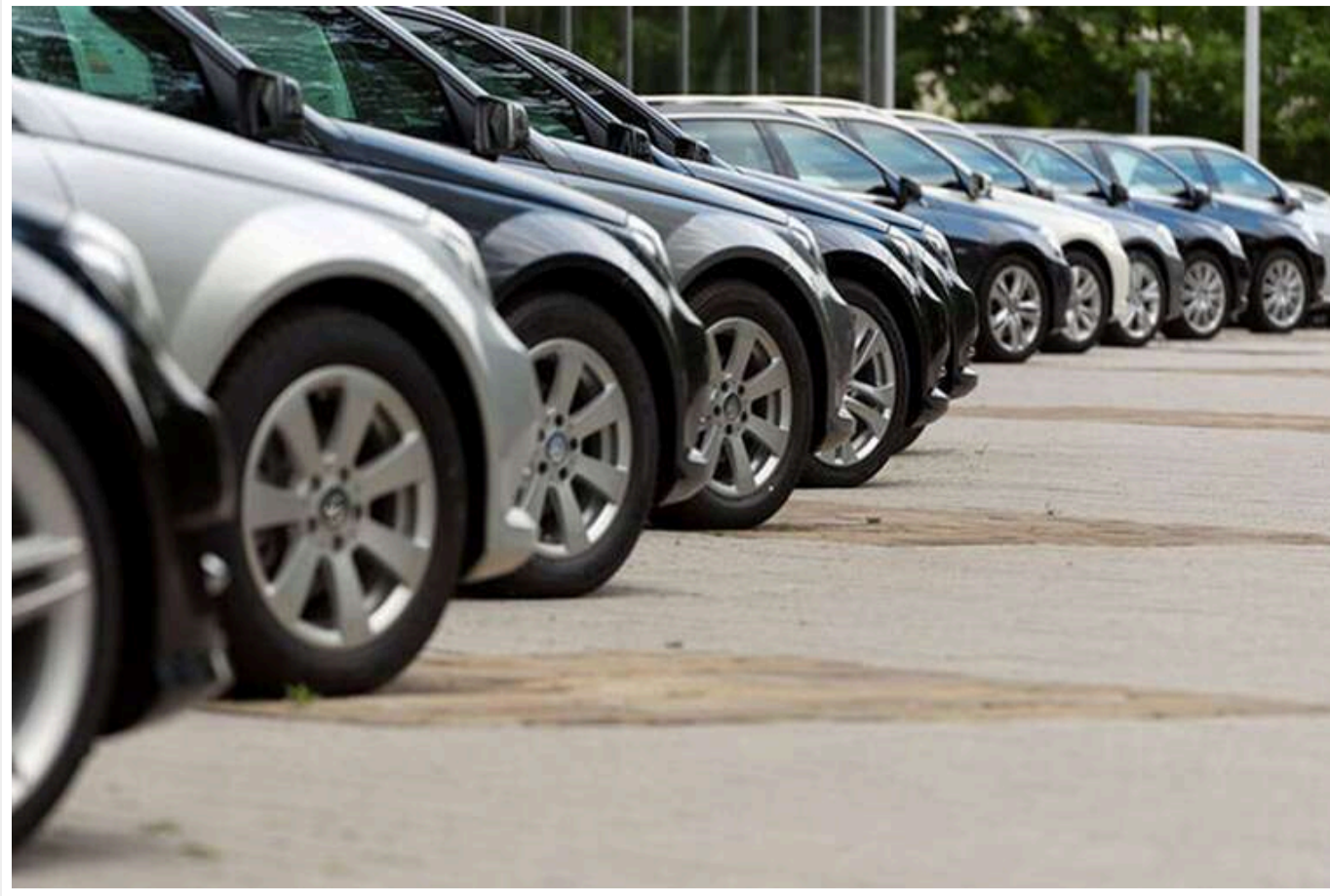
Українці масово купують нові авто, - Укравтопром

Найбільше нових легкових автомобілів у 2024 році купили мешканці Києва – 25 тис. таких машин. Найпопулярнішою моделлю виявилася RENAULT Duster, вартість якої стартує від 865 800 грн.