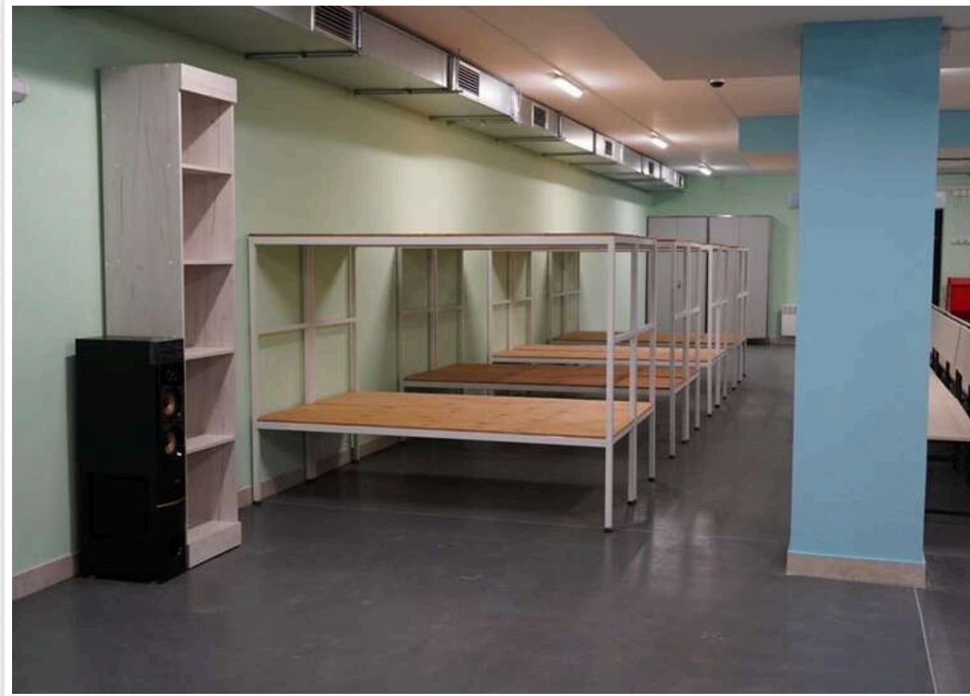
В ОВА показали, який вигляд має перша підземна школа в Сумській області

На Сумщині, на території однієї з громад Охтирського району, відкрилася перша підземна школа. Її протирадіаційним укриттям можуть користуватися як учні для навчання, так і місцеві мешканці для захисту в разі потреби.