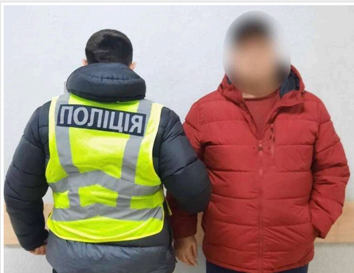
У Києві конфлікт між "собачниками" закінчився стріляниною

У Голосієвському районі Києва конфлікт між власниками собак ледь не завершився бивством. Спочатку суперечка виникла між домашніми тваринами, а згодом між їх господарями, коли один із них вистрілив іншому в обличчя з травматичної зброї.