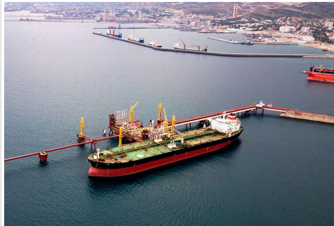
Bloomberg: Підсанкційні танкери з російською нафтою застрягли біля берегів Китаю

Три танкери з понад 2 мільйонами барелів російської нафти перебувають у водах Східного Китаю. Кораблі "застрягли" там після запровадження санкцій США проти них 10 січня.