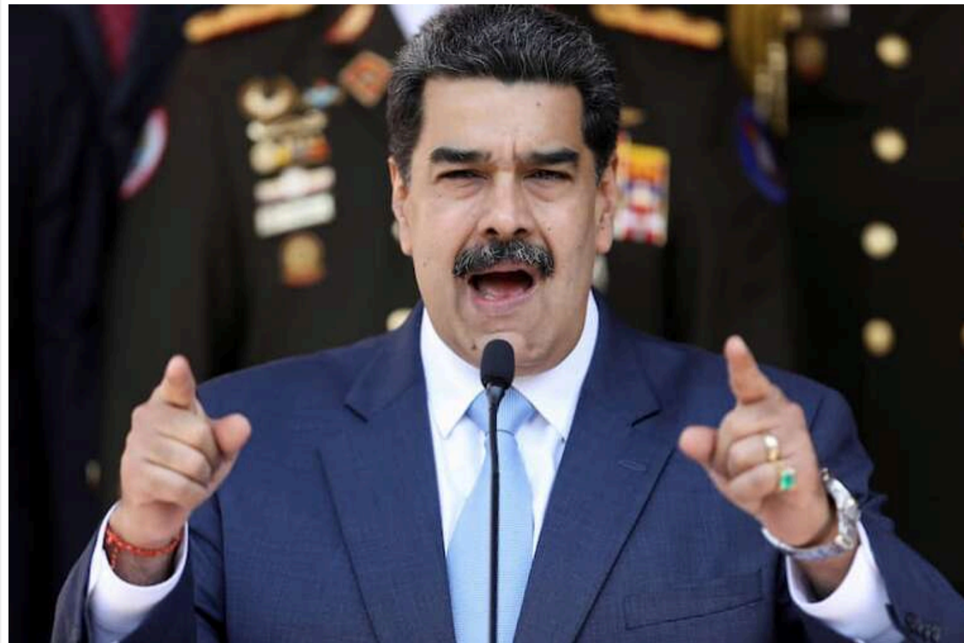
Мадуро зібрався "звільнити" від США Пуерто-Ріко

Ніколас Мадуро, самопроголошений президент Венесуели, заявив про готовність "вторгнутися" в Пуерто-Ріко й "звільнити" цю територію від США.