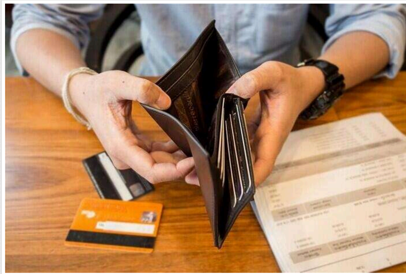
В українців з'явилось 712 453 нових боргів за рік

В Єдиному реєстрі боржників зафіксовано 8,9 млн боргів. За минулий рік українці накопичили 712,5 тисячі нових боргів.