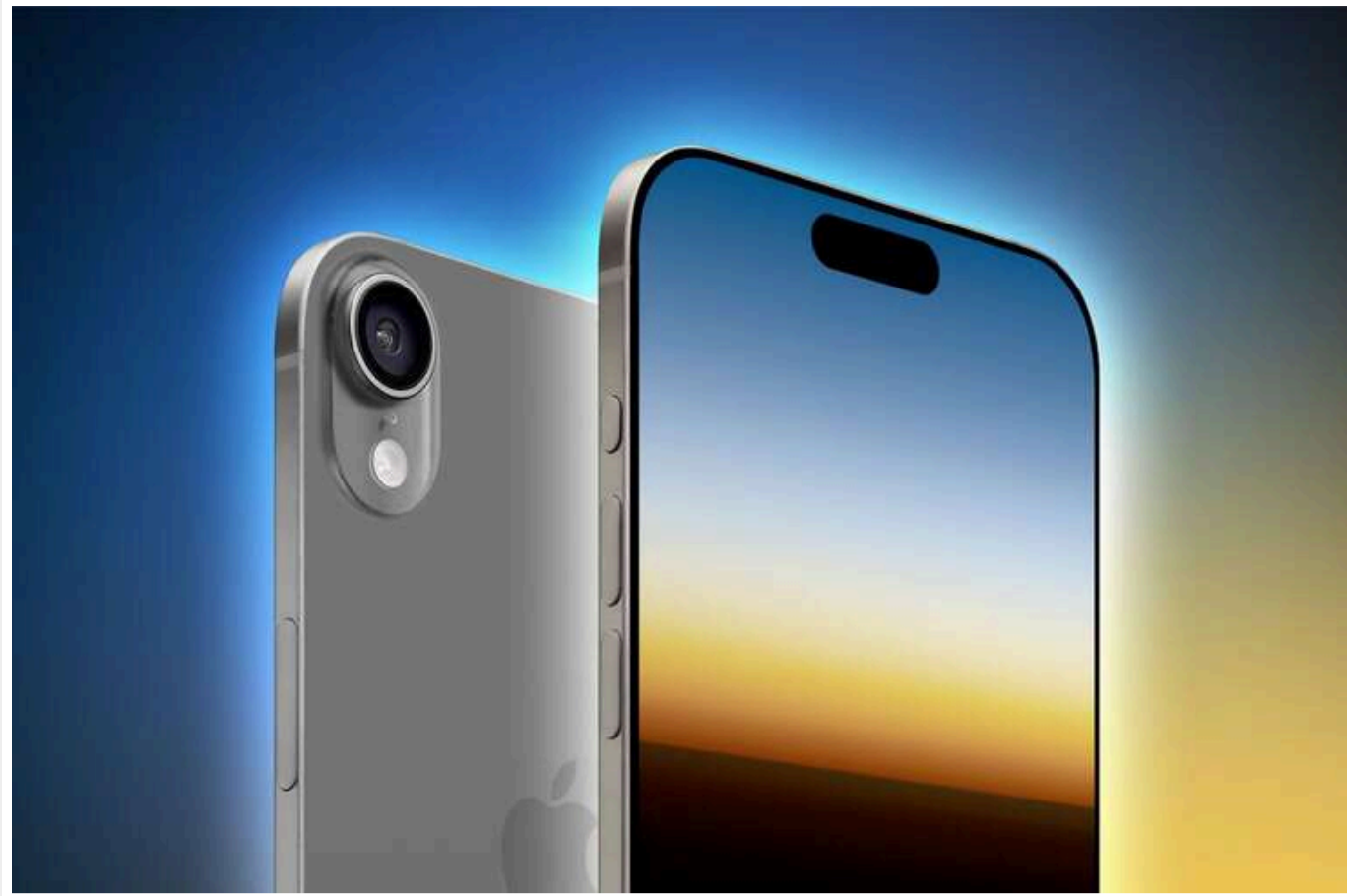
В Apple підготували новинки: iPhone Air і оновлений iPad

Марк Гурман заявив, що новий смартфон стане випробувальною платформою для майбутніх технологій компанії, і його планують випустити цього року.