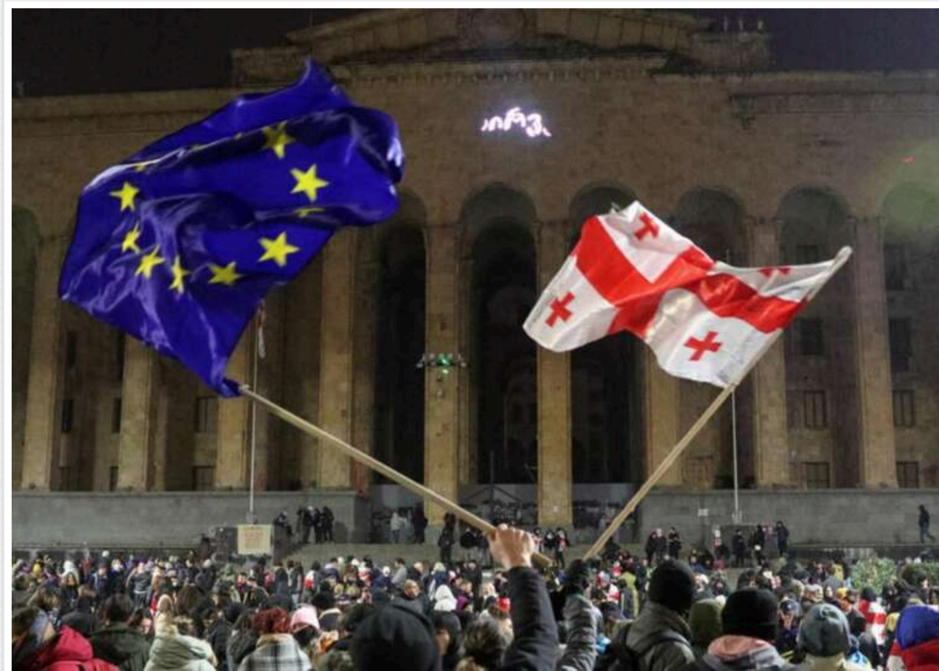
У грузинському Батумі під час проєвропейських протестів було затримано близько 10 осіб

У Батумі, Грузія, під час протестів за європейське майбутнє країни було затримано близько десяти осіб, серед яких співзасновниця двох видань.