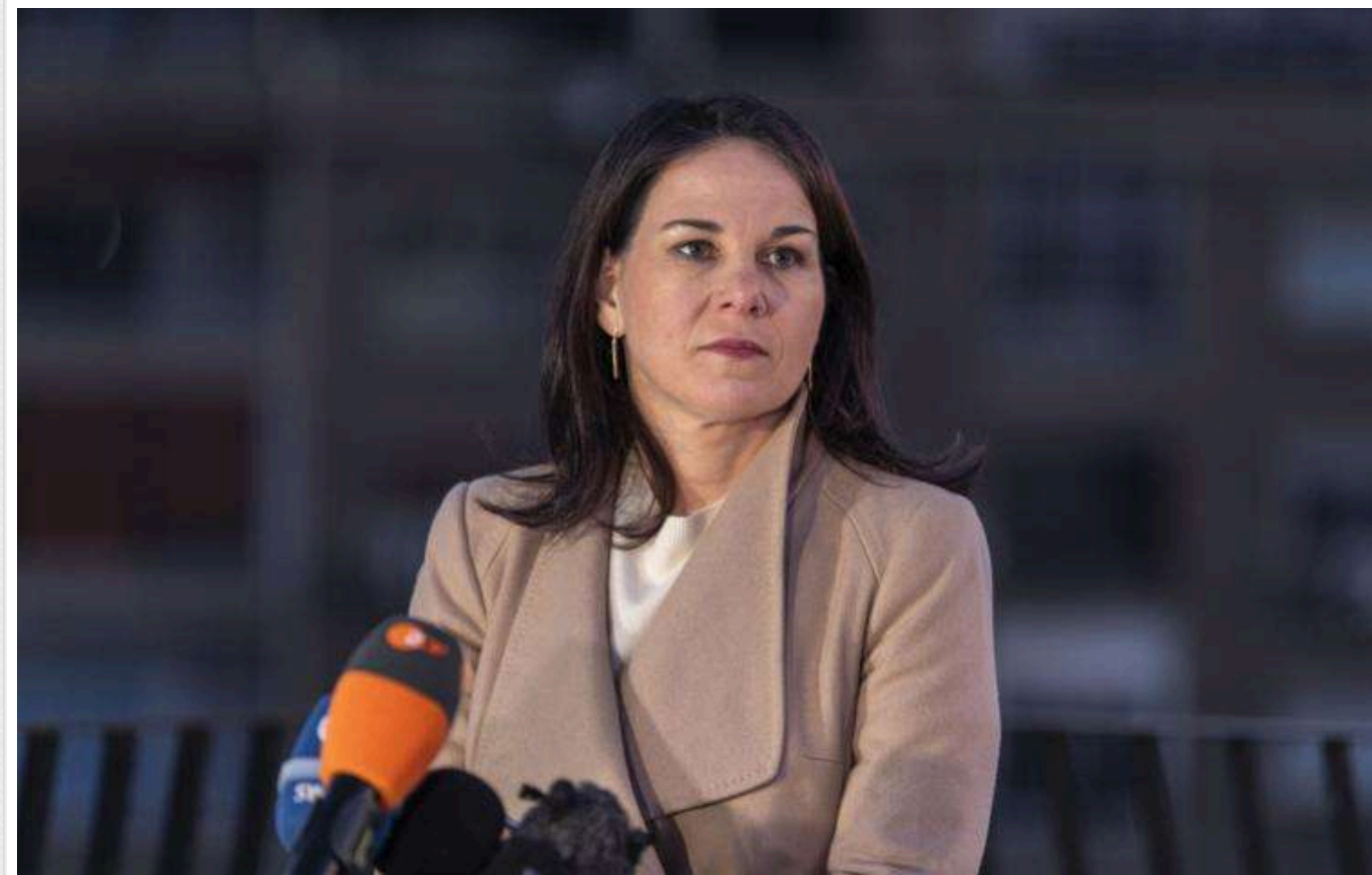
Бербок наполягає, що Німеччина повинна надати Україні більше зброї, ніж було заплановано

Міністерка закордонних справ Німеччини та співлідерка "Зелених" Анналена Бербок наголошує, що Берлін має би надати Україні більше військової допомоги, ніж заплановано в бюджеті на цей час.