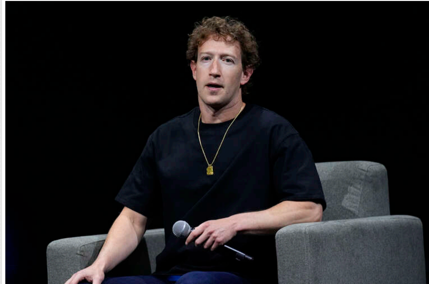
Цукерберг розкритикував Apple: «За 20 років нічого проривного, окрім iPhone»

Глава Meta Марк Цукерберг висловився про Apple, заявивши, що за два десятиліття компанія, крім запуску iPhone, не створила нічого по-справжньому інноваційного.