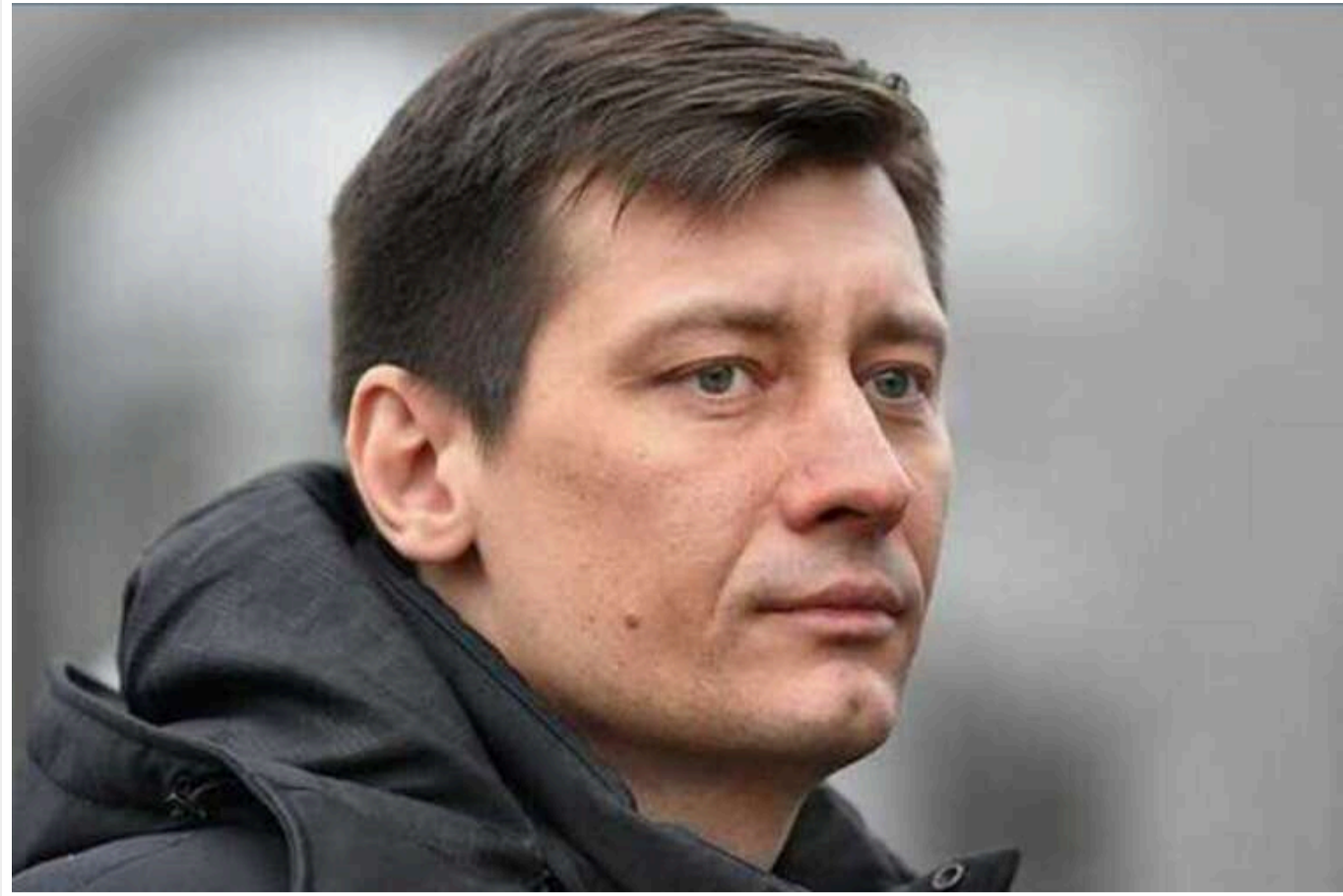
Російський опозиціонер Гудков запропонував створити «мета-Росію» на окремому острові

Російський опозиціонер Дмитро Гудков виступив з незвичайною ідеєю: він запропонував «хорошим росіянам» взяти приклад з Дональда Трампа і придбати власний острів для створення « нової Росії ».