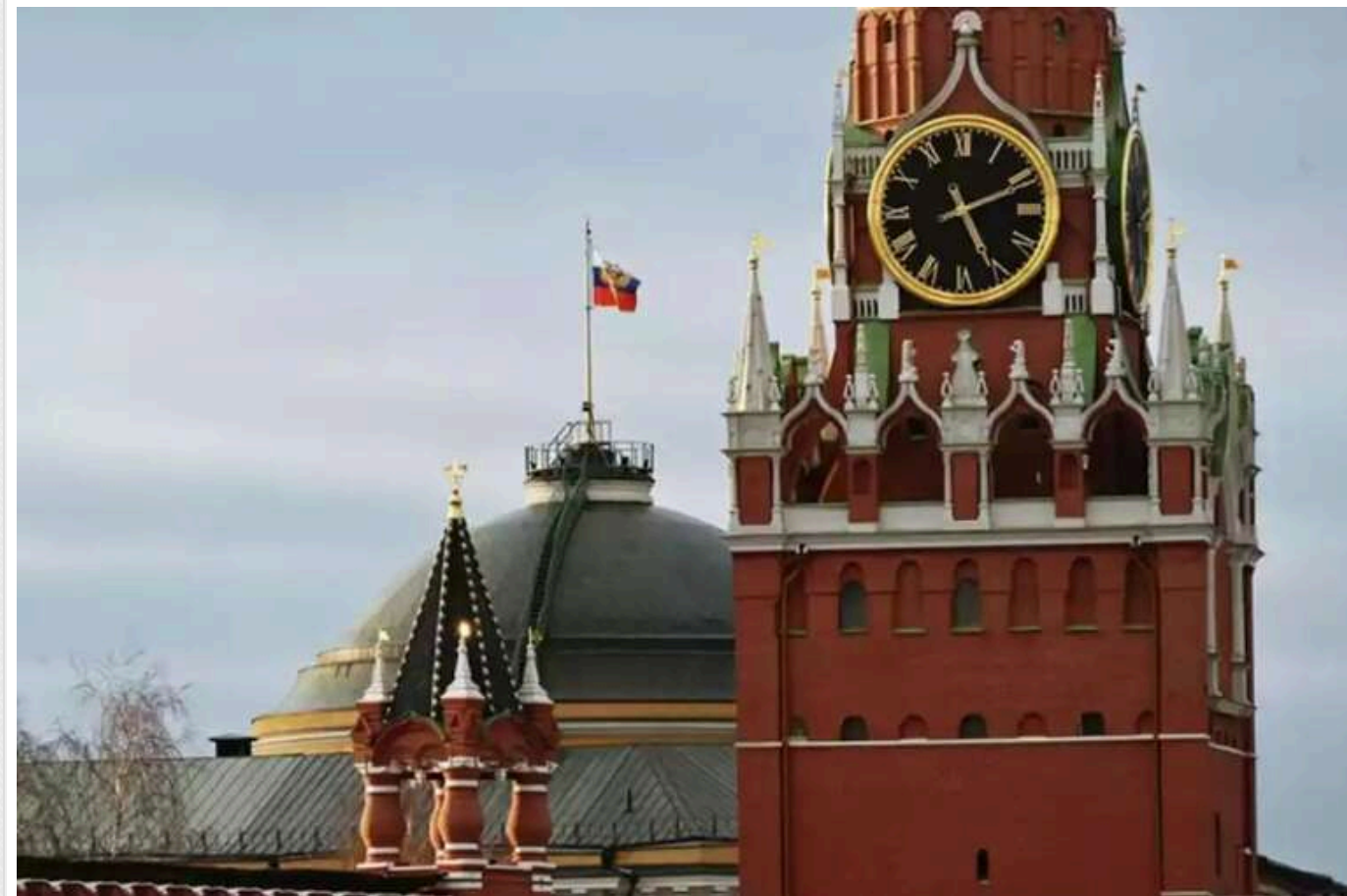
У ЦПД розповіли про сценарій розпаду Росії в наступні 50 років

Росію чекає розпад у наступні 50 років. При цьому від цього виграють не лише Україна, Захід і національні утворення, але й сама РФ.