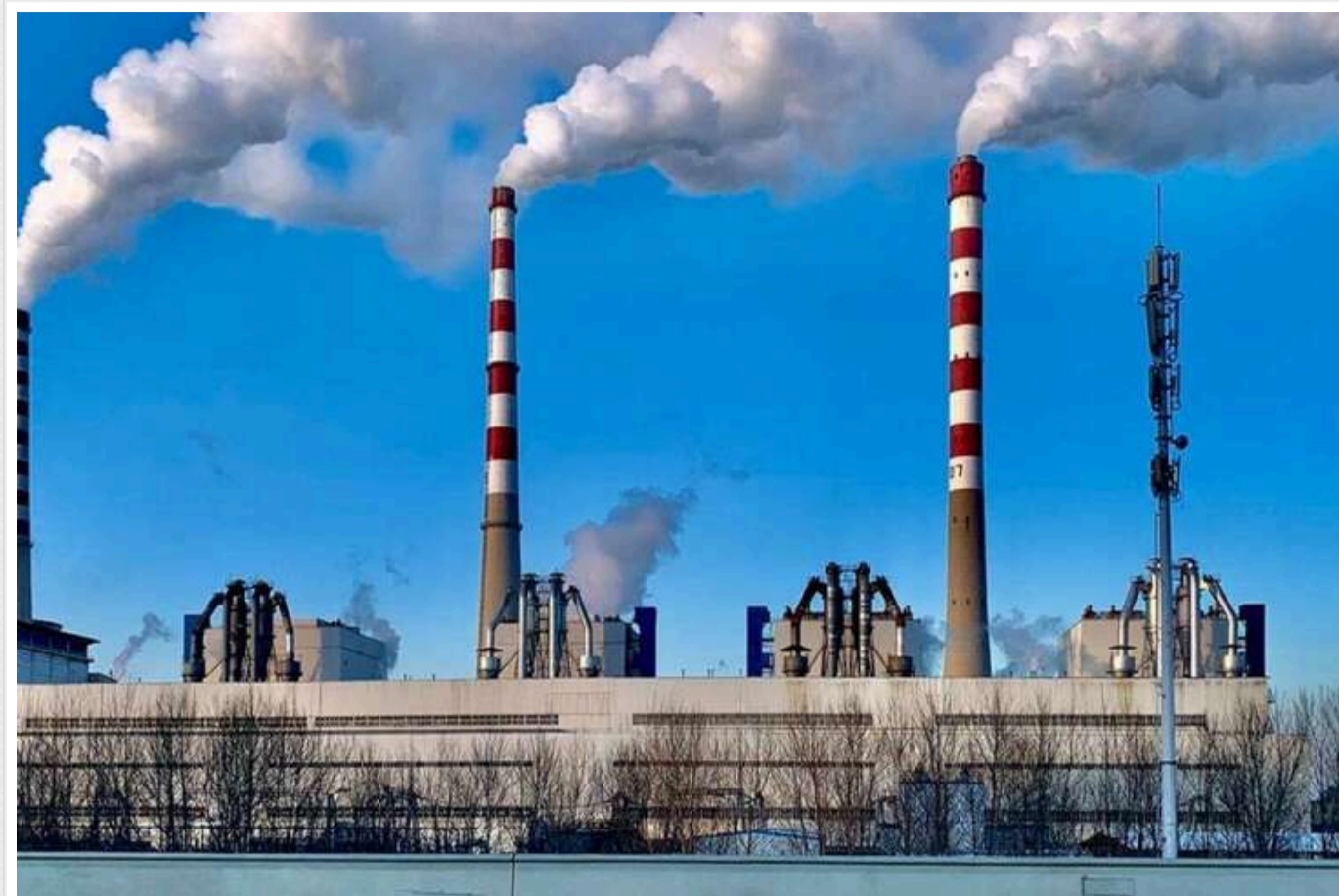
В Україні хочуть побудувати ТЕЦ, які працюватимуть на смітті

В Україні планують збудувати теплоелектроцентралі, які будуть використовувати перероблене сміття як паливо. Зараз обирають громади для будівництва.