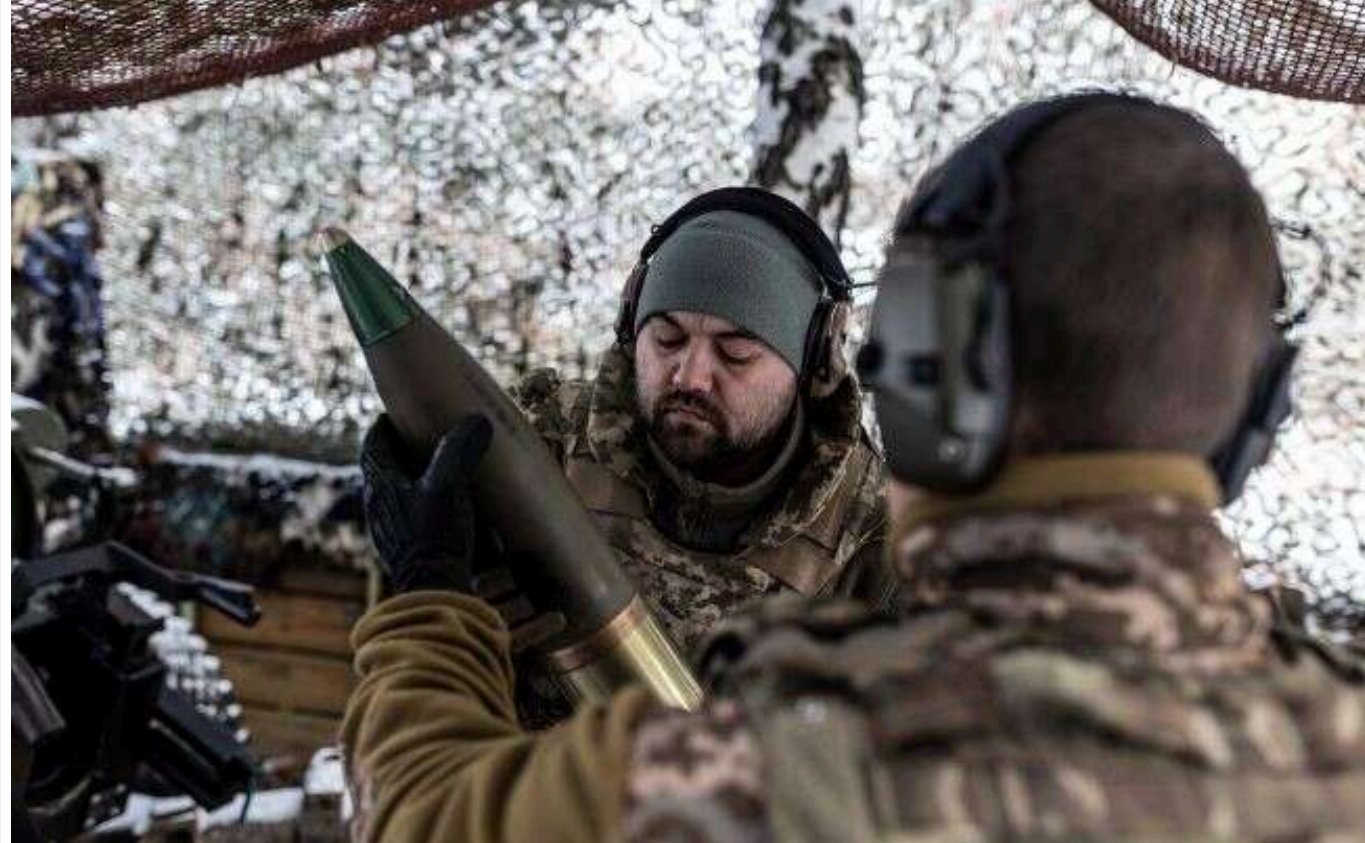
ЗСУ просуваються в Курській області, - ISW

Сили оборони України мали успіх у Курській області. У цьому регіоні фіксується просування військ ЗСУ на північний захід від Сумів.