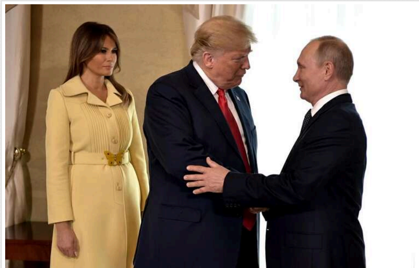
Швейцарія може надати майданчик для зустрічі Трампа та Путіна щодо України

Швейцарія виявила готовність прийняти зустріч новообраного президента США Дональда Трампа та глави Кремля Володимира Путіна щодо ситуації в Україні. Йдеться про тристоронній діалог за участю Києва.