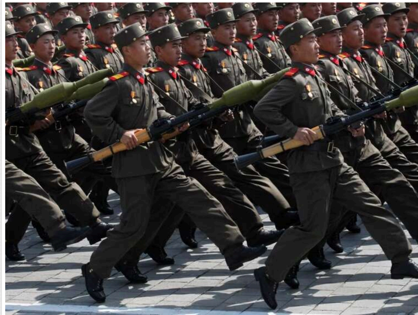
Тактика ЗСУ на Курщині створює проблеми для солдатів КНДР, - ISW

Підрозділи Північної Кореї відправляють великі штурмові групи на бойові операції в Курській області РФ, незважаючи на часті удари дронів України. Такі дії і водночас тактика ЗСУ ведуть до високого рівня втрат серед цих військ, що вже становлять близько 3800 убитими й пораненими.