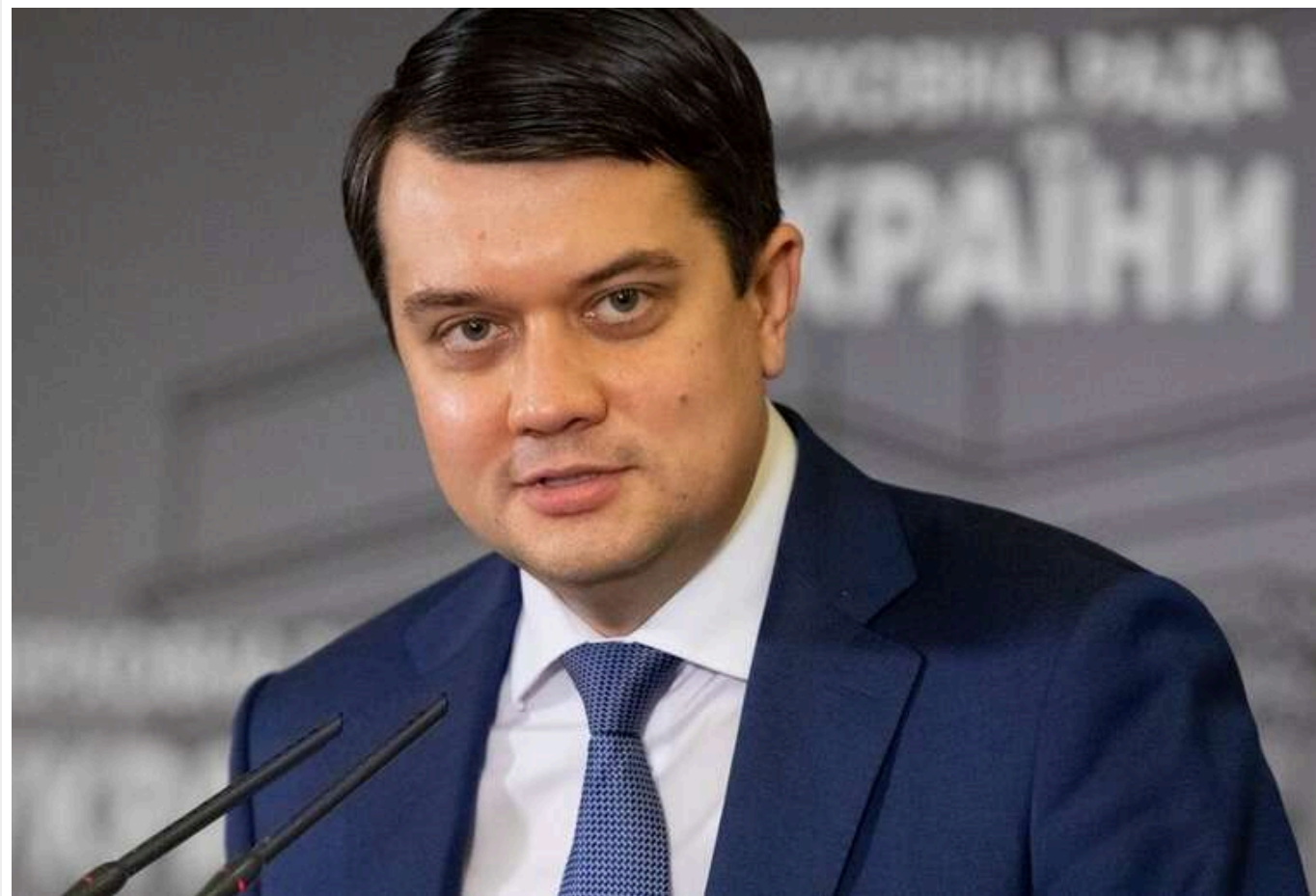
«Розумна політика» по-Разумкову: Колишній голова ВР переплутав втікача Вітренка з "Нафтогазу" з послом у Відні

Дмитро Разумков зганьбився, переплутавши Вітренка у своїй промові.