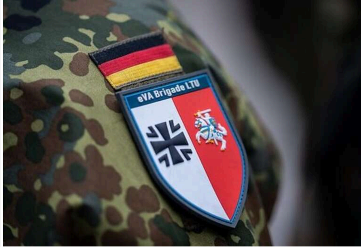
Бундесвер сформує спеціальний підрозділ для оборони важливих об'єктів Німеччини

Німецький Бундесвер планує створити новий великий підрозділ, який займатиметься охороною критично важливої інфраструктури та ключових військових об'єктів по всій країні.