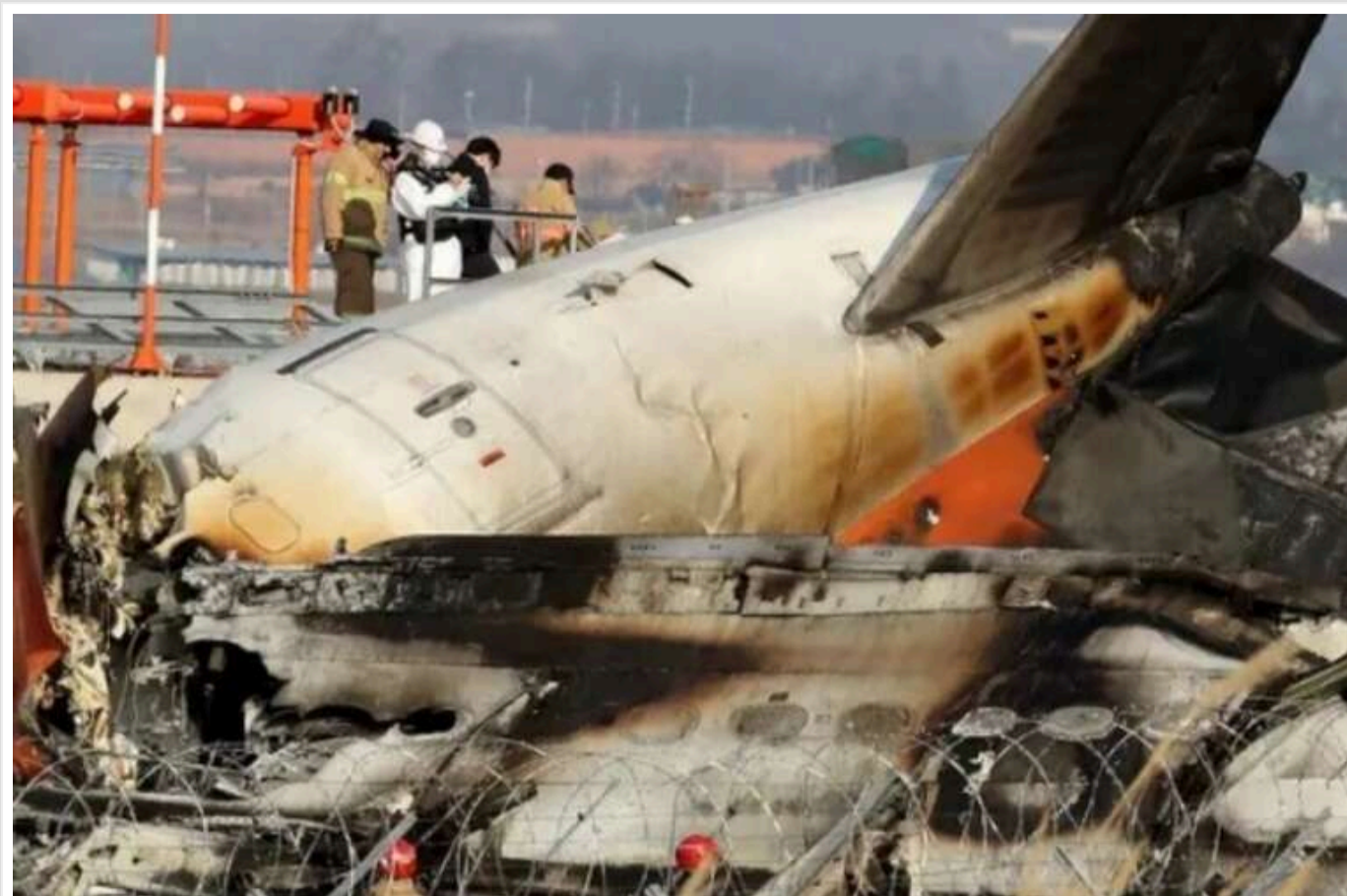
У Кореї повідомили про відсутність даних із «чорних скриньок» літака Jeju Air за 4 хвилини до катастрофи

Бортові самописці літака авіакомпанії Jeju Air, що зазнав аварії 29 грудня, перестали записувати приблизно за чотири хвилини до того, як літак врізався в бетонну огорожу в південнокорейському аеропорту «Муан».