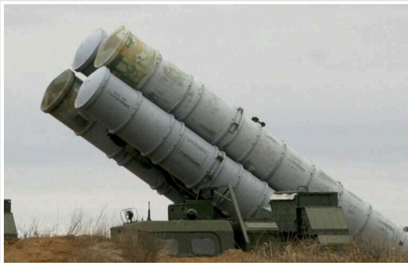
Російська ППО не в змозі захистити стратегічні об'єкти, окрім резиденції Путіна та Москви, – ЦПД

Система протиповітряної оборони Росії виявляється неспроможною захистити стратегічні об'єкти Російської Федерації, за винятком резиденції керівника Кремля Володимира Путіна та Москви.