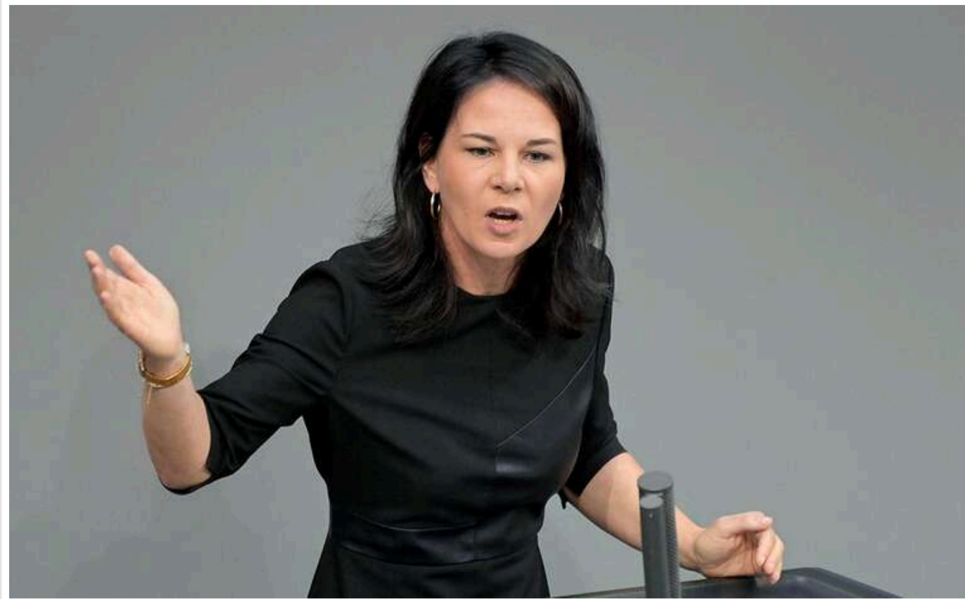
Ризик для ЄС становлять іржаві танкери "тіньового флоту" РФ, - Бербок

Так званий тіньовий флот Росії не лише уникає західних санкцій. Він також становить загрозу для Європейського Союзу.