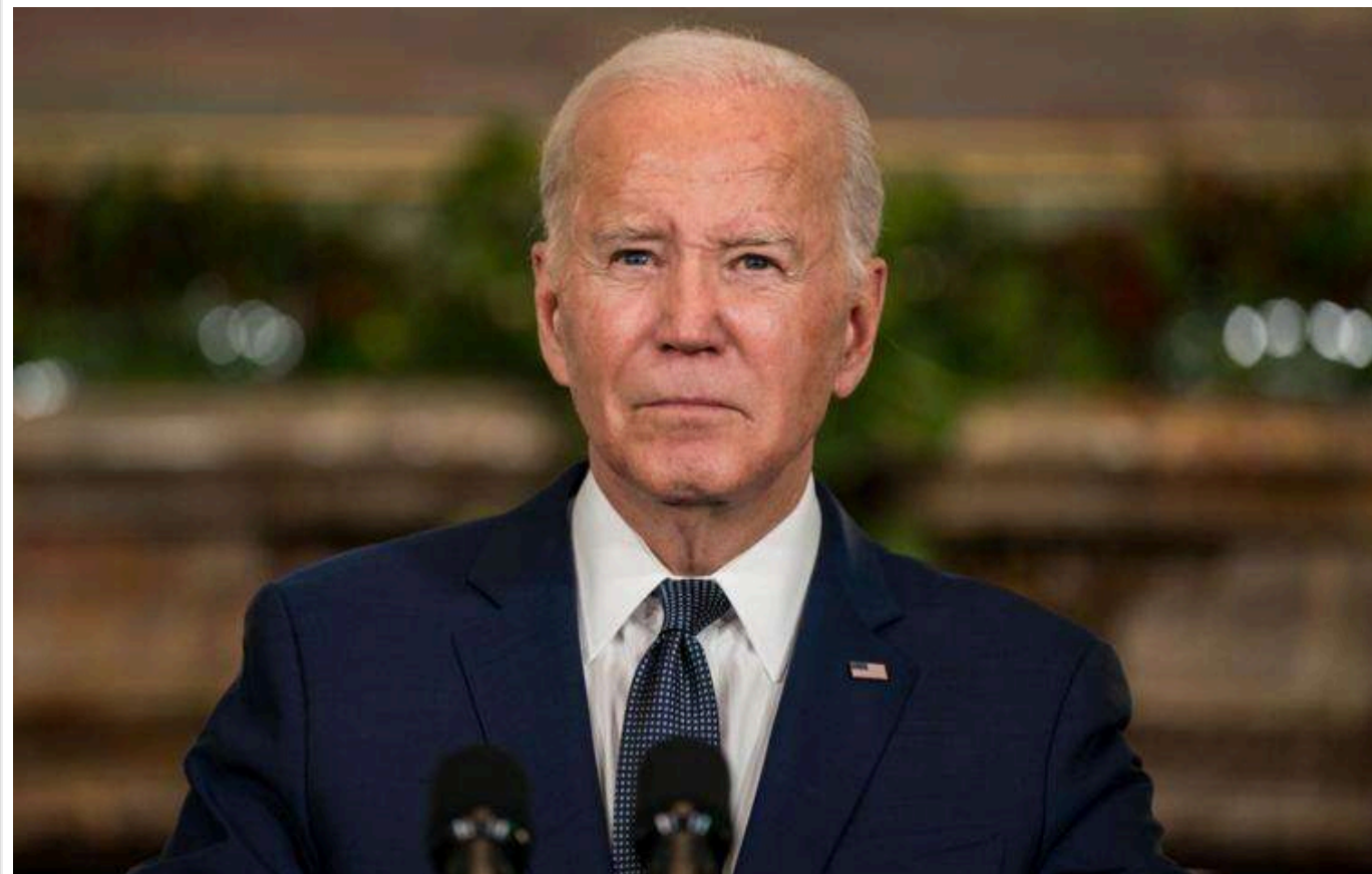
Байден не встиг використати майже 4 мільярди доларів на військову допомогу Україні

Після надання адміністрацією чинного президента США Джо Байдена остаточного пакету військової допомоги Україні на 500 млн доларів у рамках програми президентських повноважень (Presidential Drawdown Authority або PDA) залишилося ще близько 3,8 млрд доларів. Ці невикористані кошти все ще можуть бути спрямовані на допомогу Києву, але рішення щодо цього ухвалюватиме вже нова американська адміністрація.