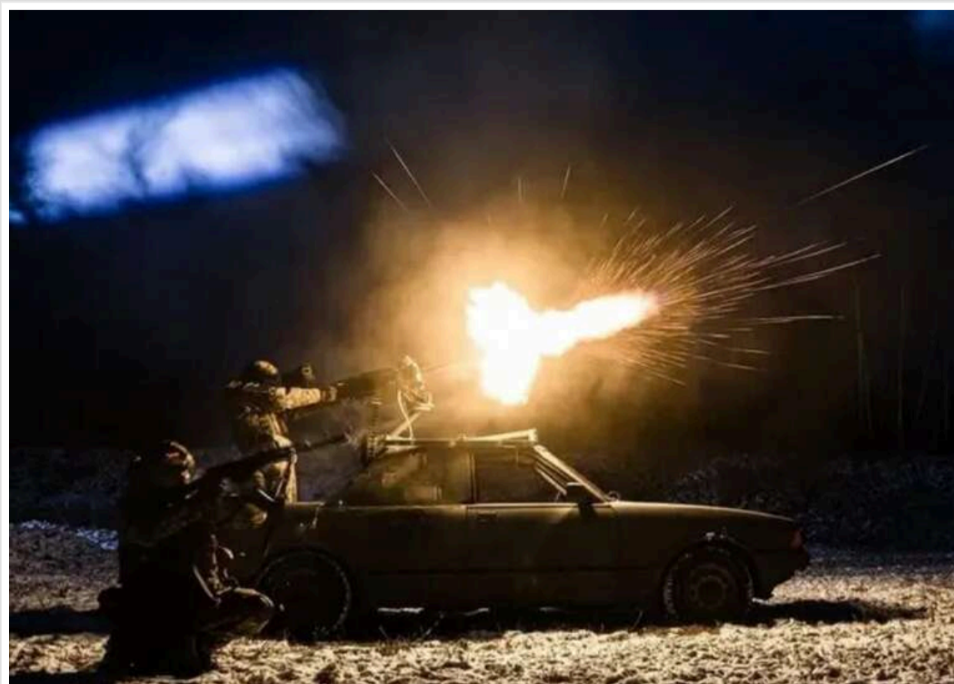
Сили ППО вночі знищили 47 ворожих дронів, ще 27 не досягли цілей

У ніч проти 11 січня російські війська здійснили нову повітряну атаку на Україну: ворог використав 74 ударні БПЛА та дрони інших типів. Сили ППО збили 47 російських безпілотників.