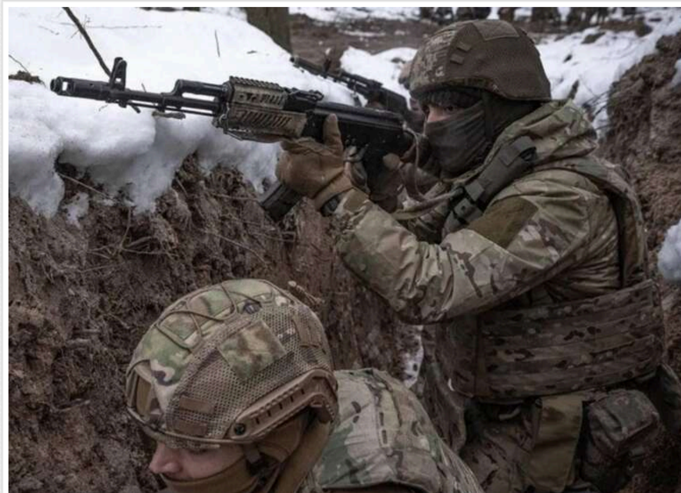
Ситуація на фронті: за минулу добу ЗСУ відбили 213 атак

Російські окупанти продовжують наступальні дії, намагаючись прорвати оборону ЗСУ. Протягом доби зафіксовано 213 бойових зіткнень, повідомляє Генштаб України в ранковому зведенні 11 січня.