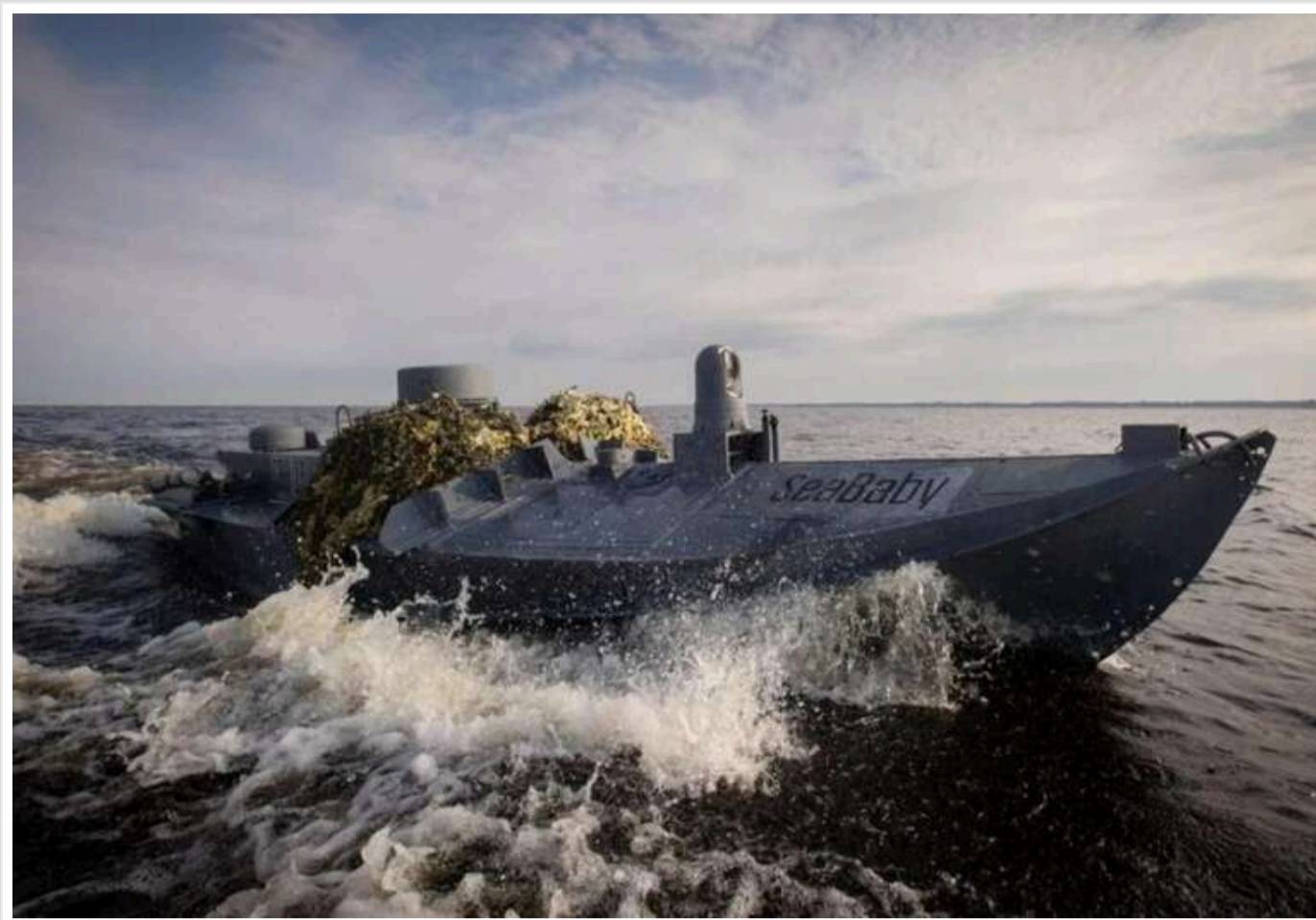
Дії українських морських дронів змусили росіян зменшити кількість операцій із вертольотами над Чорним морем, – ISW

Українські морські дрони змусили Росію зменшити кількість польотів гелікоптерів над Чорним морем. Зокрема, російські війська мало проводили вертолітні операції 9 січня.