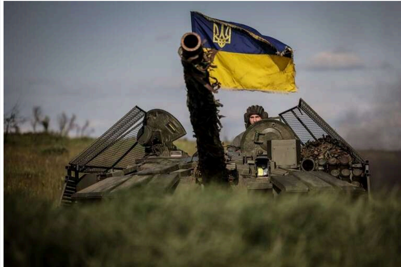
Ситуація на фронті: Відбулося 166 бойових зіткнень, найбільше - на Покровському та Лиманському напрямках

Від початку дня, станом на 16:00, на фронті відбулося 166 бойових зіткнень.