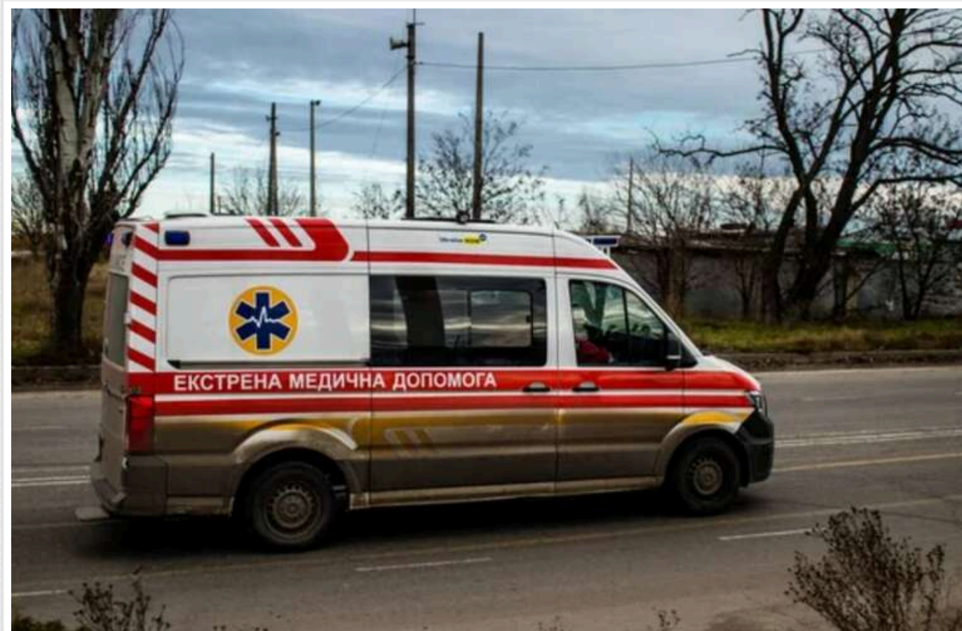
На Херсонщині протягом доби внаслідок атак РФ загинула одна людина, ще 16 зазнали поранень

Протягом минулої доби, 9 січня, російські війська атакували 41 населений пункт Херсонської області, внаслідок чого одна людина загинула і ще 16 зазнали поранень.