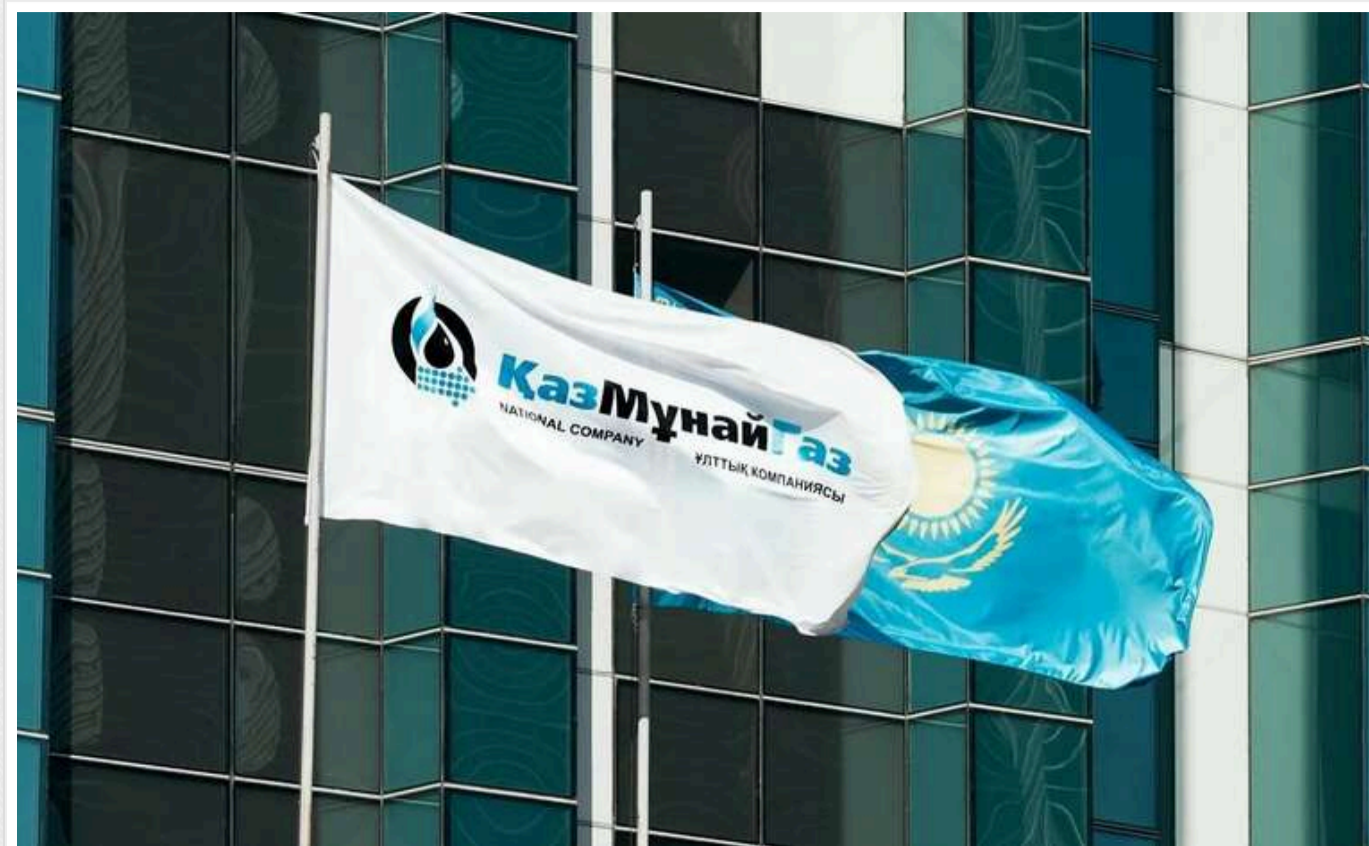
Казахстанська компанія запропонувала 1 мільярд доларів за НПЗ російської компанії «Лукойл» у Болгарії

Казахстанська державна нафтогазова компанія «КазМунайГаз» запропонувала 1 мільярд доларів США за придбання Lukoil Neftochim Burgas, єдиного нафтопереробного заводу в Болгарії, який наразі належить російській компанії «Лукойл».